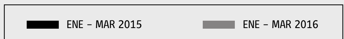
INDICADOR DE CUMPLIMIENTO REGULARIDAD ESTACIONALIDAD

Comparando con el mismo trimestre del año anterior en el caso del indicador Regularidad día completo. Inversiones Alsacia presenta la mayor alza de un 3% logrando el mínimo exigido.